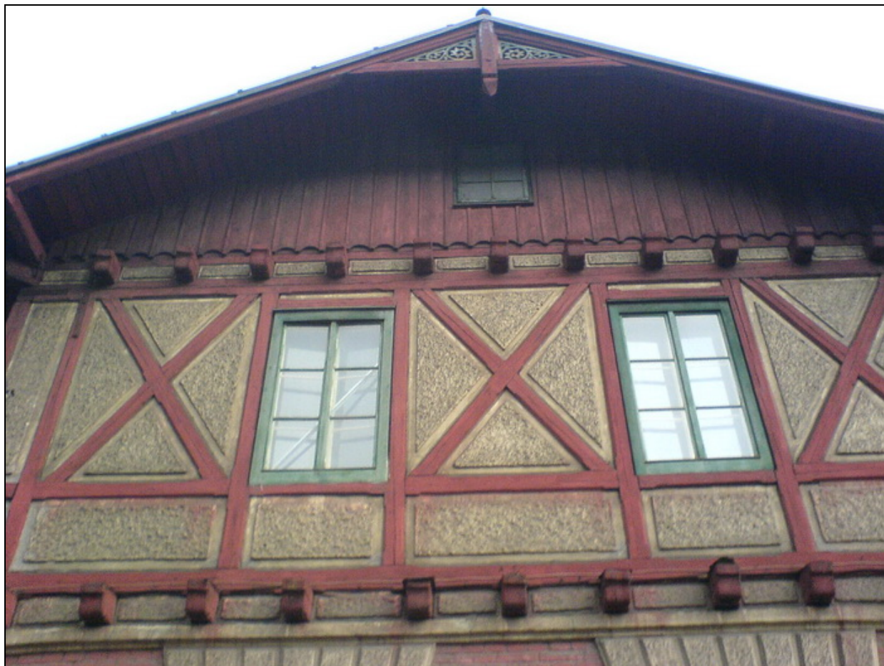
Detail nádražní budovy v Ústí nad Orlicí, Pardubický kraj, Česká republika