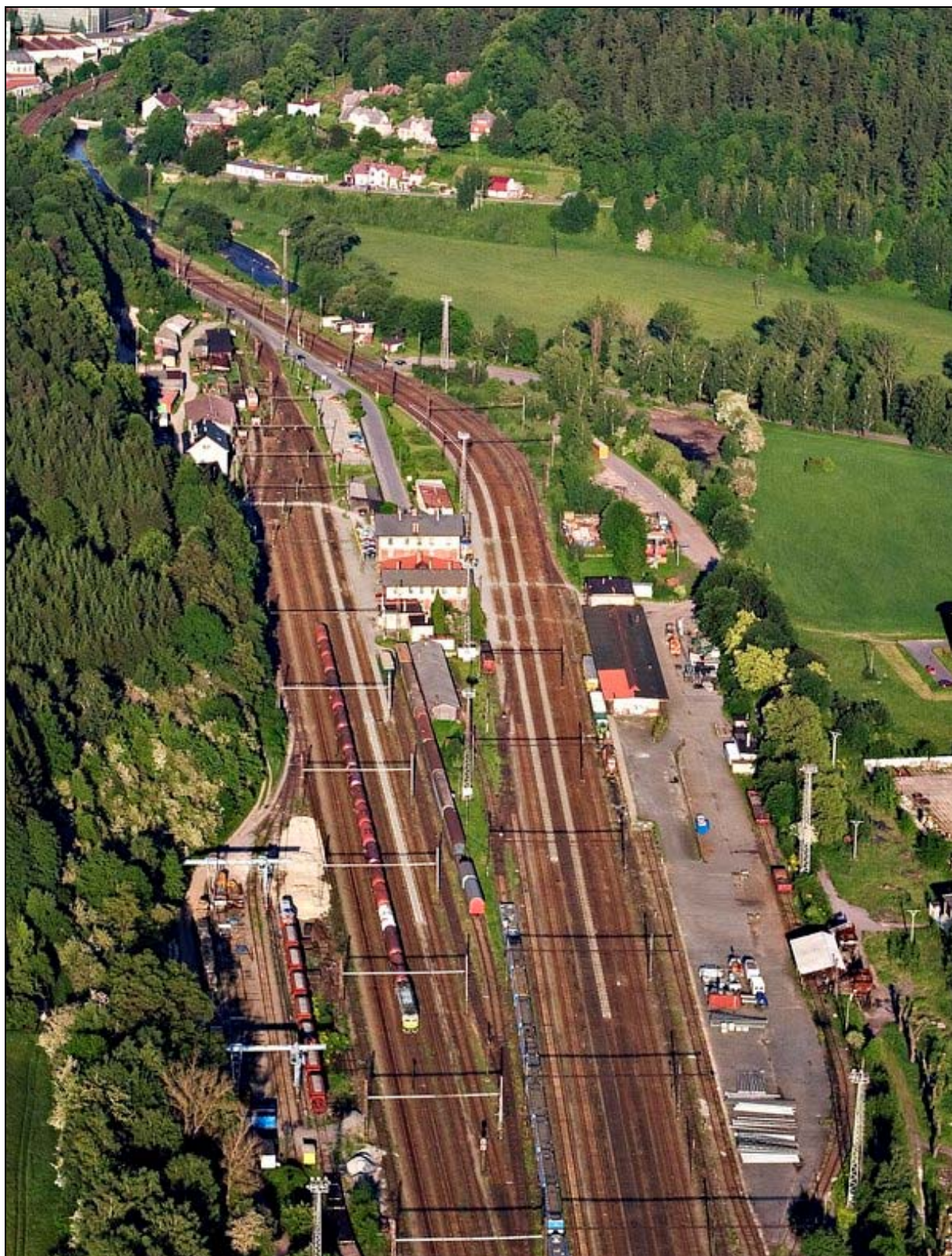
Letecký pohled na nádraží v Ústí nad Orlicí , Pardubický kraj, Česká republika